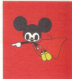
Sopra, "Michelangelo-Creazione Mickey" di Tomoko Nagao; in alto, di reFreshInk; a sinistra, Cesare Gozzetti per i Cibartisti; al centro, "11" di Jader Bonfiglioli (Galleria in alto a sinistra, "Autoritratto nel p" di Paolo