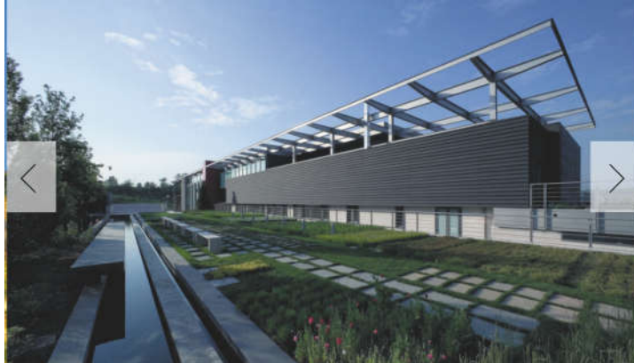
FEUDI DI SAN GREGORIO