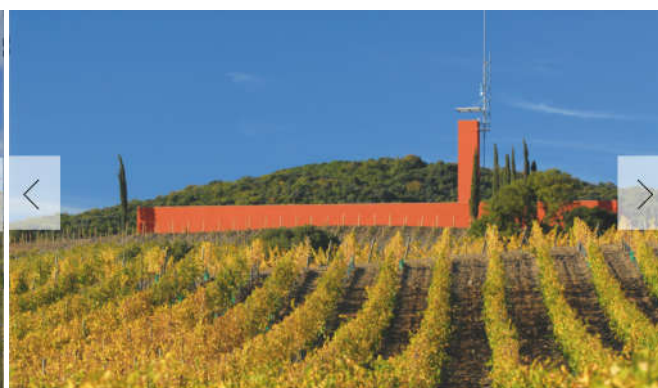
ROCCA DI FRASSINELLO