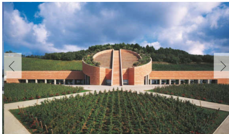
PETRA TERRA MORETTI